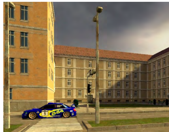
Obrázek 3: Virtuální terapeutická scéna přechodu přes silnici (Tichá, M. et al; 2014)

V průběhu terapie je možné simulovat problémové situace zaměřené na aktivity běžného života, například nakupování nebo přechod přes rušnou silnici (obr. 3). Pro nácvik řízení motorových vozidel mohou být využívány trenažéry s volantem a pedály.