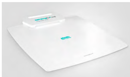
Obrázek 2: Příklad plantografické plošiny ( www.physiosensing.net ; 2018)

Pro terapii poruch rovnováhy je často využívána stabilometrická nebo plantografická plošina (obr. 2), pomocí níž lze sledovat polohu kolmého průmětu těžiště pacienta na plošinu nebo i detailnější rozložení tlaku pod chodidly (Corbetta, D. et al; 2015). Je možné detekovat a terapeuticky ovlivnit například snížený rozsah pohybu těžiště do všech směrů nebo stranovou asymetrii stoje.